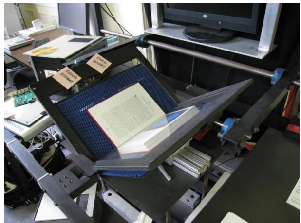
Afbeelding 2: digitalisering als dimensie van en voor macht 2

De kwestie van de 'mediacratie' onderstreept het belang van politiek bewustzijn en de ontwikkeling van een sociale levenskunst. Veiligheidssystemen zijn noodzakelijk voor het reguleren van sociale media en informatietechnologie, doch zijn nooit 'waterproof'. Bovendien staat het dichttimmeren van het sociale leven door regels ten bate van veiligheid, privacy en professionaliteit op gespannen voet met ethiek en levenskunst als vrijheidspraktijken. Die vragen vrije ruimte om zonder dwang rechtvaardige sociale verhoudingen te creëren. Er dient politiek richting te worden gegeven aan de huidige 'mediacratie' en 'twittercratie' (Heleen Rippen, 2012), zonder in een verstikkende bureaucratie te belanden. In plaats van 'big brother is watching you' het vormen van een moreel kompas en bewustwording als wereldburger; met sociale communities als tegenmacht. Daarom is het utopische denken geen achterhaalde en naïeve opvatting maar