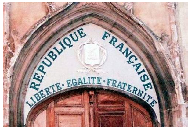
Afbeelding 3: Vrijheid, gelijkheid en broederschap 3

Onderdrukkende sociale structuren houden lang stand, ondanks revoluties, protest- en emancipatiebewegingen. Machtsmotieven en behoudzucht van de heersende klassen spelen in op onverschilligheid en angst van de massa. Ze versterken elkaar over en weer. In die zin beheersen heerszucht en angst, begeerte en hebzucht zowel het wereldtoneel als de krochten van de ziel. De gemoederen worden gedirigeerd door onderbuikgevoelens jegens ‘de ander’ en ‘het andere’, dat zich in