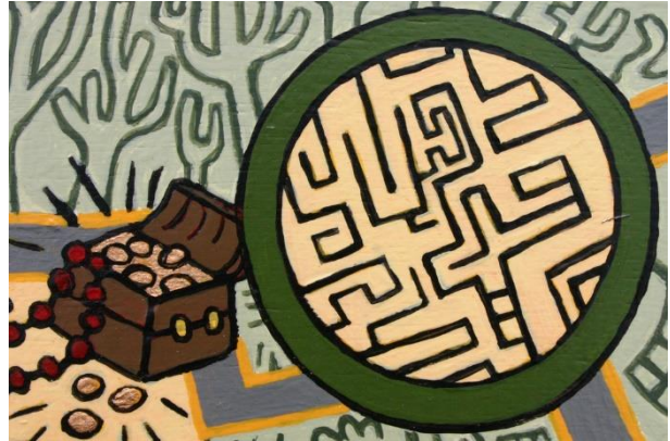
Afbeelding 4: het labyrint – uit Mens, ken je zelf

Het Delphische orakel, de Pythia, de priesteres van de Apollotempel, bemiddelt met haar voorspellingskunst hetgeen Apollo vanuit hemelse hoogte aanschouwt.