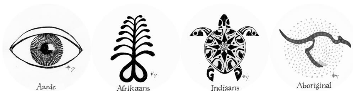
De pictogrammen voor aarde wegen in het Wijsheidsweb – grafische vormgeving: Louis Van Marissing

Het imperialisme heeft tot forse sociaaleconomische en culturele ontwrichting geleid, ook na de koloniale periode, zoals bijvoorbeeld door de Golfoorlogen. Nog duidelijker met de ‘war on terror’ als reactie op 09/11 die tot meer chaos in het Midden-Oosten leidde en het geweld van en tegen ‘IS’. Deze ‘oorlogsverklaring’ vanuit westerse allianties op een onduidelijke (‘terroristische? islamitische?') vijand en wat zich in de smeulende en opnieuw uitbarstende en zich verspreidende conflicthaarden daarna heeft voorgedaan, kan mogelijk vanuit een ‘laat-modern’ perspectief als een ‘derde wereldoorlog’ en kantelpunt naar een andere wereldorde worden gezien.