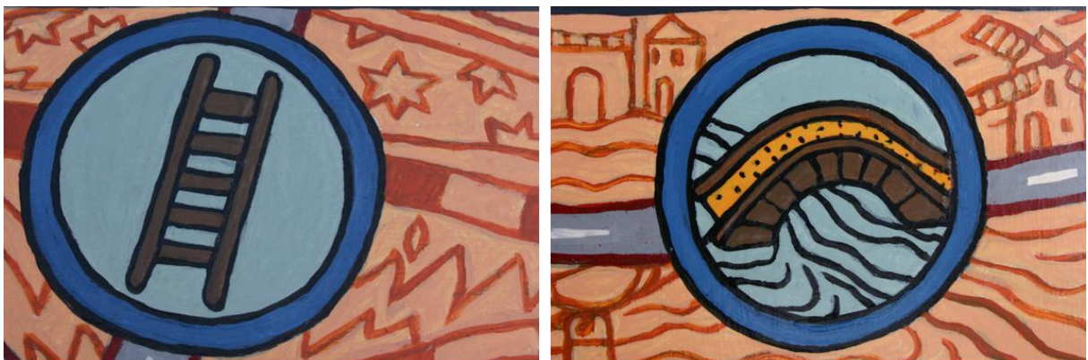
Afbeelding 3: De filosofische ladder en brug – uit Mens, ken jezelf

In dit tweede deel wordt het filosofische spoor door de wijsheidstraditie van levenskunst vervolgd. Hermeneutiek, de kunst van betekenisgeving en interpretatie, vormt de basis voor het bouwen van bruggen en ladders tussen tijdperken en (sub)culturen.