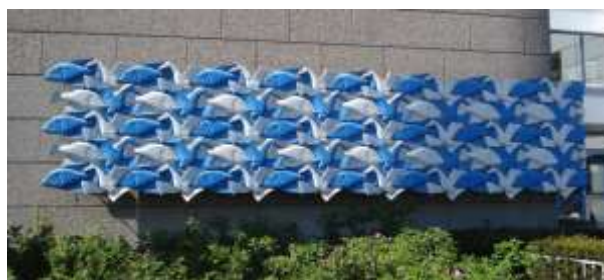
Afbeelding 9: interessante tussenvormen 8

Het geeft geen pas de verantwoordelijkheid af te schuiven en erop te wijzen 'dat anderen zich aan ons moeten aanpassen'. In een globaliserende wereld heeft iedere wereldburger een eigen rol te spelen, terwijl er voor verantwoordelijke bestuurders en gemeenschappen een collectieve verantwoordelijkheid ligt. Tussen reflexen in – dat je als persoon alleen toch niets aan problemen op wereldschaal kunt doen en het naar boven of naar anderen wijzen dat zij hierin de aangewezen personen zouden zijn – ligt de wijze middenweg van het oppakken van ieders ver-antwoord-elijkheid. De woordbetekenis wijst op een ethische laag: dat we als mens een antwoord te geven hebben door het eigen hart te laten spreken en hoe 'klein' ook als eenling verschil te maken. Zo opent zich de koninklijke weg van een mediale, elementaire en interculturele levenskunst.