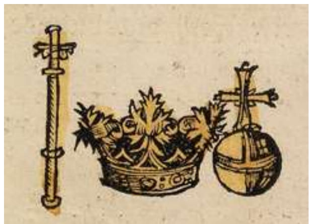
Afbeelding 1: Symbolen van macht: de scepter, de kroon en de rijksappel. Regalia van het Romeinse Rijk 1

Regimes komen en gaan, idealen van levensgeluk, sociaal welzijn en rechtvaardigheid blijven bestaan. Machtsinstituten (van religieuze of wereldlijke signatuur) zijn minder gemakkelijk te veranderen dan het vervangen van een marionet in het theater van de macht. Sociale structuren van overheersing blijken taai en zijn lastig te transformeren – vooral wanneer ze in de haarvaten van een samenleving, in culturele mythen, sociale codes, rituelen en symbolen zijn ingebakken – “De koning is dood, leven de koning!”