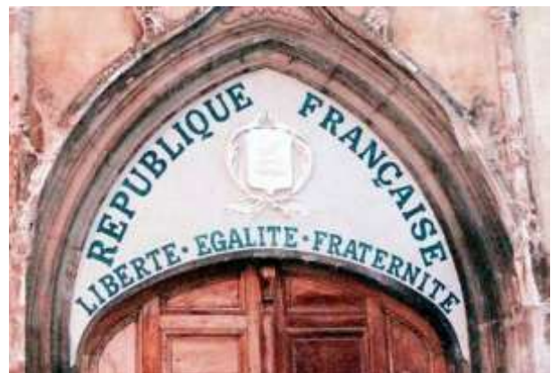
Afbeelding 3: Vrijheid, gelijkheid en broederschap 3

Onderdrukkende sociale structuren houden lang stand, ondanks revoluties, protest- en emancipatiebewegingen. Machtsmotieven en behoudzucht van de heersende klassen spelen in op onverschilligheid en angst van de massa. Ze versterken elkaar over en weer. In die zin beheersen heerszucht en angst, begeerte en hebzucht zowel het wereldtoneel als de krochten van de ziel. De gemoederen worden gedirigeerd door onderbuikgevoelens jegens ‘de ander’ en ‘het andere’, dat zich in