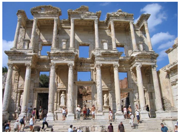
Afbeelding 2: begin van de ‘westerse filosofie’ ligt in het nabije Oosten: Efese 1

Klassieke perspectieven op levenskunst van deels ‘interculturele’ herkomst helpen het huidige instrumentele denken en de platte betekenis van ‘geluk’, ‘authenticiteit’, ‘spiritualiteit’ uit de populaire levenskunst te verrijken. De filosofische scholen van levenskunst bevonden zich op kruiswegen van ‘oosterse’ en ‘zuidelijke’ regio’s en