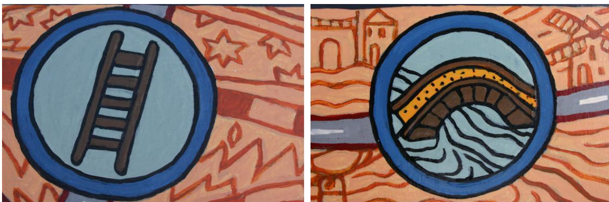
Afbeelding 3: De filosofische ladder en brug – uit Mens, ken jezelf

In dit tweede deel wordt het filosofische spoor door de wijsheidstraditie van levenskunst vervolgd. Hermeneutiek, de kunst van betekenisgeving en interpretatie, vormt de basis voor het bouwen van bruggen en ladders tussen tijdperken en (sub)culturen.