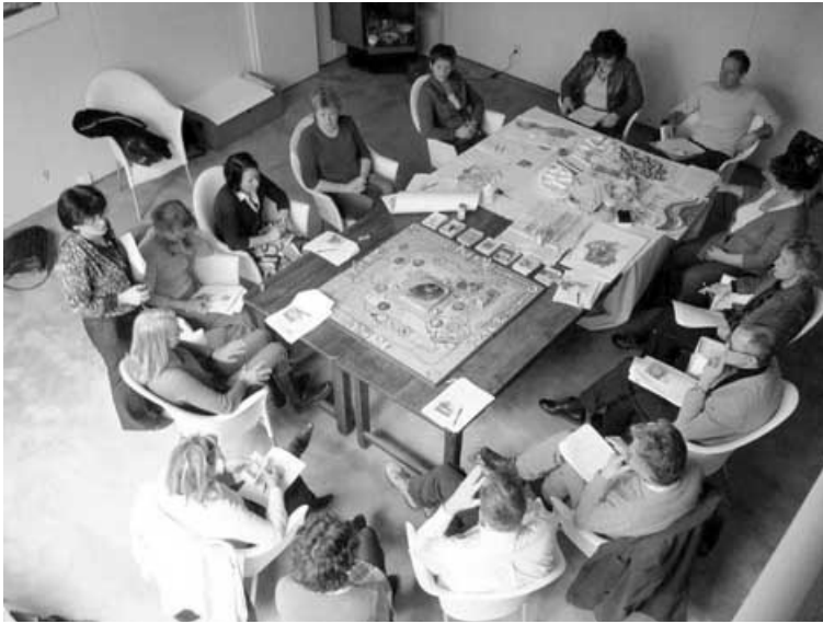
Figuur 1 Beeld van het spel.

lijk los (bijv. alleen de kaarten of het spel beperkt tot een spelronde) en in combinatie met elkaar worden gebruikt.