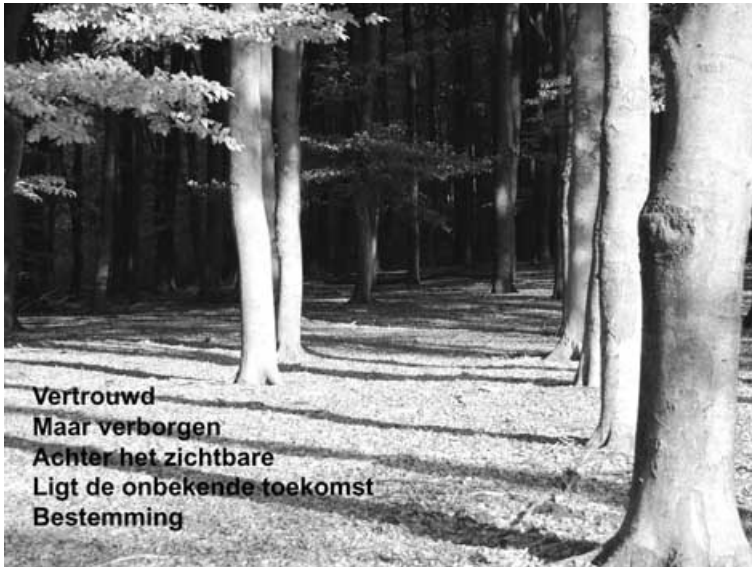
Figuur 4 Natuurbeeld met elfje.

In dit voorbeeld heeft de supervisant een serie foto's gemaakt met natuurbeelden die een sfeer oproepen, passend bij het betreffende levensthema. De opdracht bestond uit een beeldende typering hoe een belangrijk levensthema vroeger, nu en met het oog op de toekomst speelt door middel van typerende beelden, elfjes en/of haiku's.