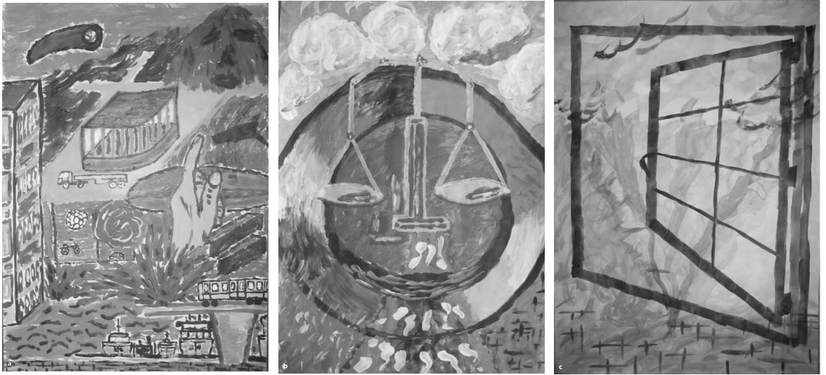
Figuur 6 Drieluik verleden (a), heden (b) en toekomst (c).

zich ontwikkelende relatie tussen begeleide en begeleider vormen voor mij de focus en het ijkpunt voor de supervisie boven vooraf besproken doelen of de eenmaal gevolgde methode. In die zienswijze is het supervisietraject veeleer een ontdekkingsreis dan een geboekte reis of vakantie. De metafoer van de ontdekkingsreis vind ik treffend om aan te geven dat het binnen mijn dialogische en existentiële benadering een ‘natuurlijke’ en ‘logische’ stap kan zijn om de formele grens van de gerichtheid op beroepsuitoefening te overschrijden en ruimte te geven aan zich aandienende levensthema’s, waarbij zich ook therapeutische momenten kunnen voordoen.